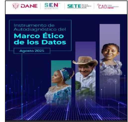
Formulario de autoevaluación ética