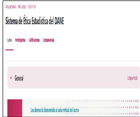
Curso Marco Ético de los Datos