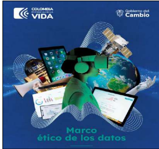
Marco Ético de los Datos